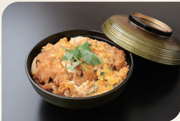
八女豚ロースのカツ丼