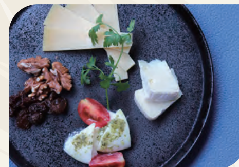
チーズの盛り合わせ