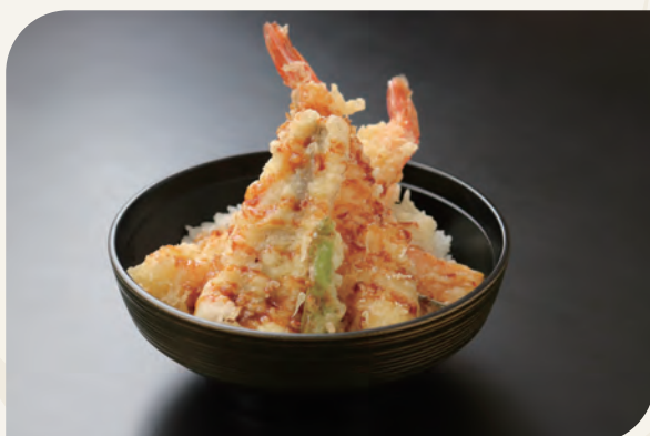
大海老と穴子天丼