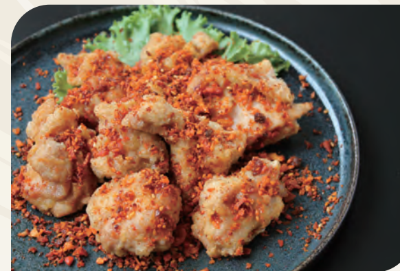
ピリ辛 湖南スパイス掛け大山どりの フライドチキン (8個)