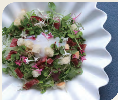
サラダ・リヨネーズ