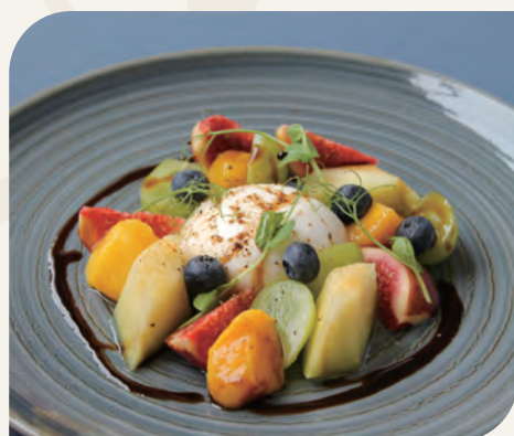
ブラータチーズと 季節のフルーツのサラダ