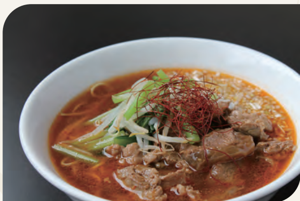
奈義和牛麻辣湯麺