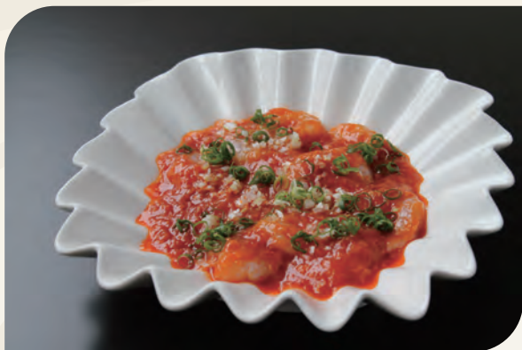
海老のチリソース