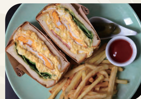
エッグホットサンドイッチ