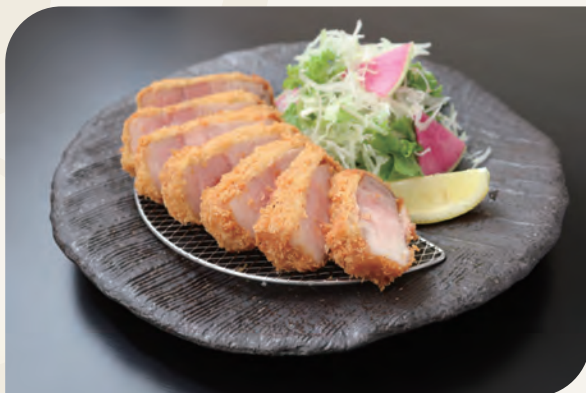
熟成厚切り八女豚ロースカツ膳